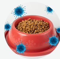
COMEDOUROS, BEBEDOUROS OU BRINQUEDOS